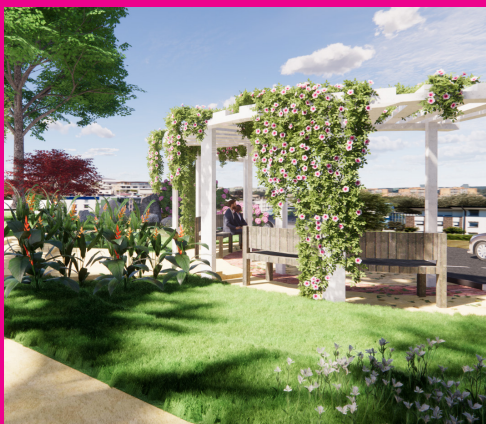
Pemacu TVET Komuniti Setempat

Program ini merupakan latihan kemahiran berdasarkan proses kerja sebenar. Ianya terbuka kepada semua lapisan masyarakat yang telah menamatkan dan lulus Sijil Pelajaran Malaysia. Dijalankan secara sepenuh masa dan secara semester. Tempoh setiap semester adalah 6 bulan, selama tempoh 2 tahun termasuk latihan industri difirma-firma tempatan dan agensi kerajaan