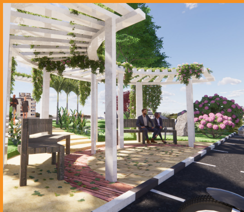
Pemacu TVET Komuniti Setempat

Program ini merupakan latihan kemahiran berdasarkan proses kerja sebenar. Ianya terbuka kepada semua lapisan masyarakat yang telah menamatkan dan lulus Sijil Pelajaran Malaysia. Dijalankan secara sepenuh masa dan secara semester. Tempoh setiap semester adalah 6 bulan, selama tempoh 2 tahun termasuk latihan industri difirma-firma tempatan dan agensi kerajaan