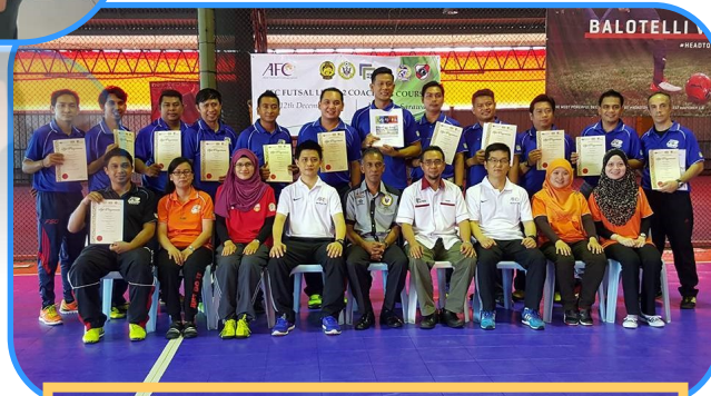
Kenangan sewaktu Kursus Kejurulatihan Futsal AFC pada 2015